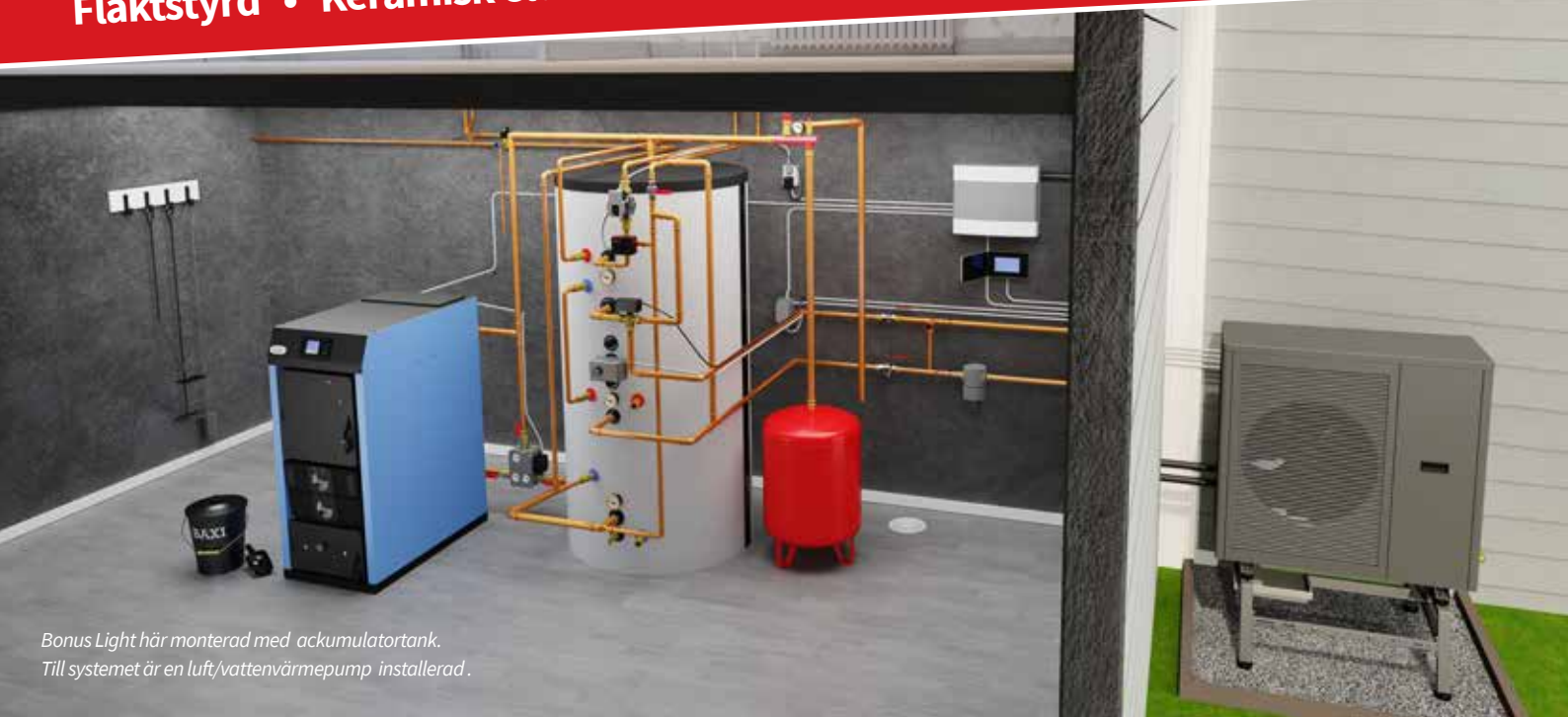
Bonus Light här monterad med ackumulatortank. Till systemet är en luft/vattenvärmepump installerad.

30 kW • Hög verkningsgrad • Ecodesign Stora luckor • Halvmeters ved • 90 liter vedmagasin Fläktstyrd • Keramisk eldstad