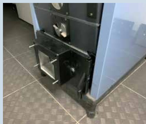
Pelletsluckan på Bonus Light (tillbehör).