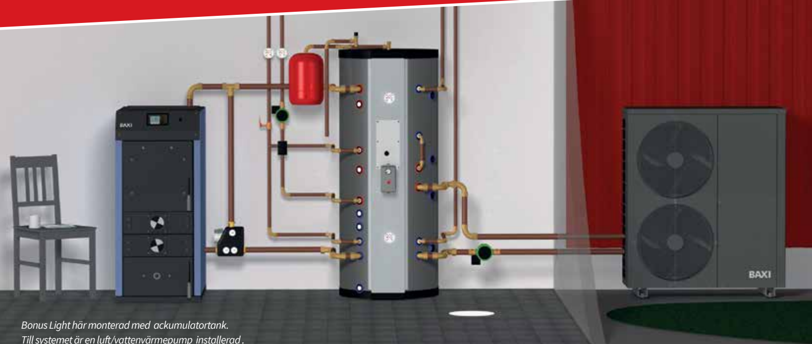
Bonus Light här monterad med ackumulatortank. Till systemet är en luft/vattenvärmepump installerad.

30 kW • Hög verkningsgrad • Ecodesign • Stora luckor • Halvmeters ved 90 liter vedmagasin • Fläktstyrd • Keramisk eldstad